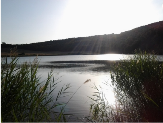
Vista de la laguna desde el litoral.