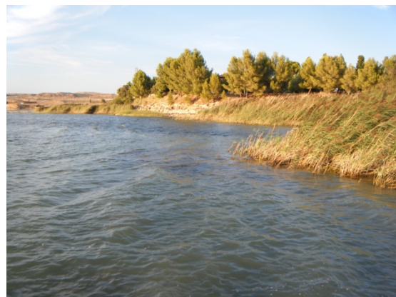
Vista del litoral.