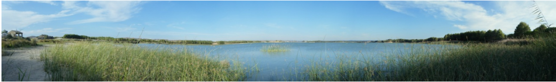
Vista panorámica de la laguna.