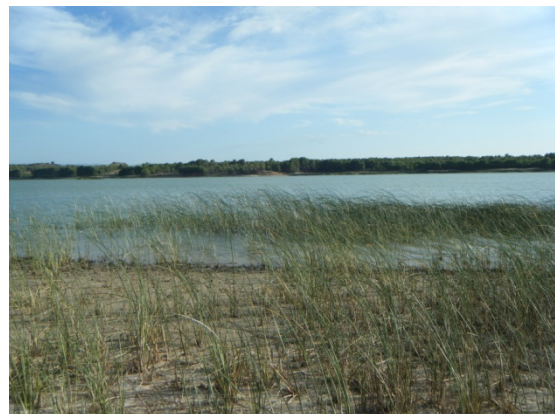
Vista de zona de helófitos de la orilla.