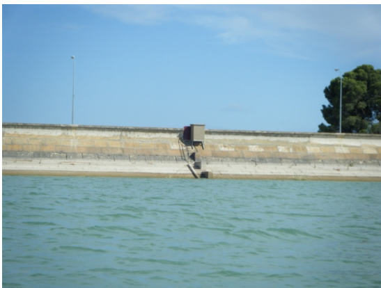
Vista de la presa.