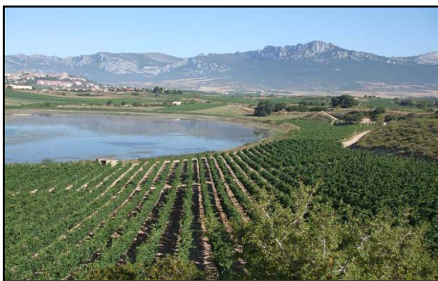
Vista de la zona litoral del lago