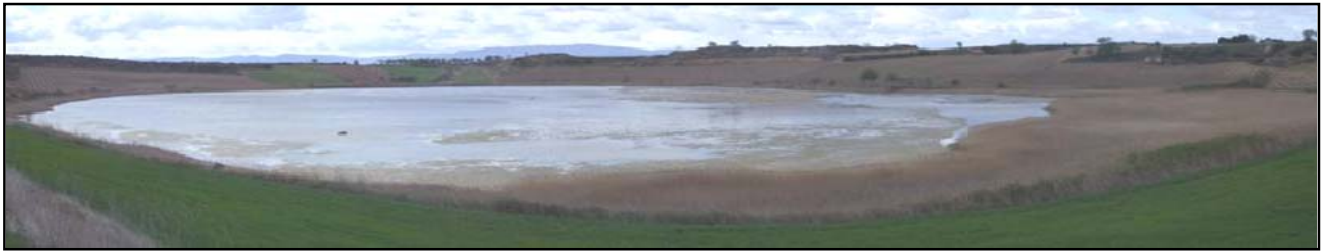
Imagen del lago a finales de verano de 2008