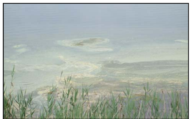
Litoral del lago con acumulaciones de polvo de azufre (primavera 2009)