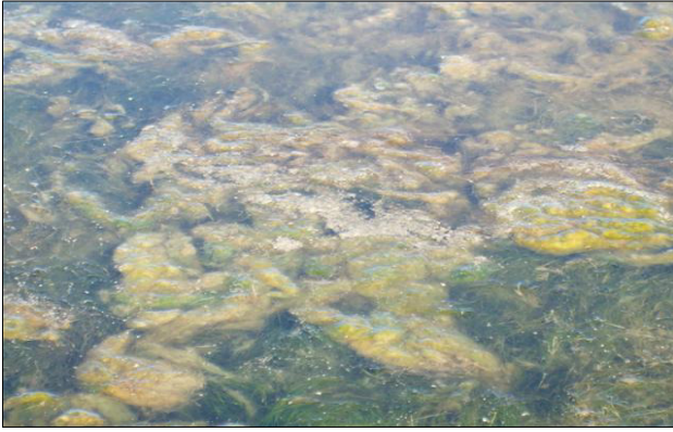
Algas filamentosas presentes en el lago