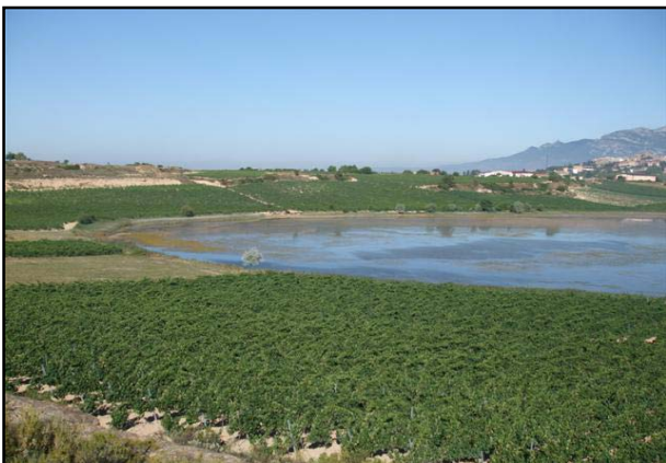
Imagen de los viñedos que rodean al lago