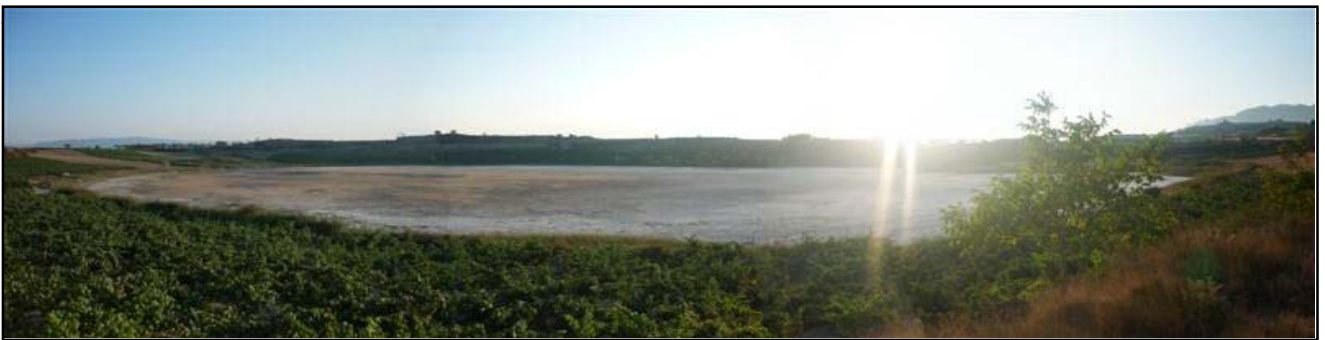
Imagen del lago practicamente seco en verano de 2009