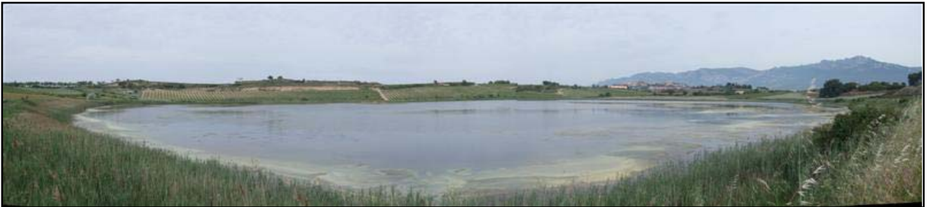
Imagen del lago en primavera de 2009